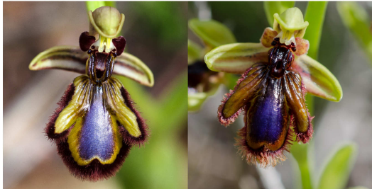
Ophrys speculum subsp. speculum